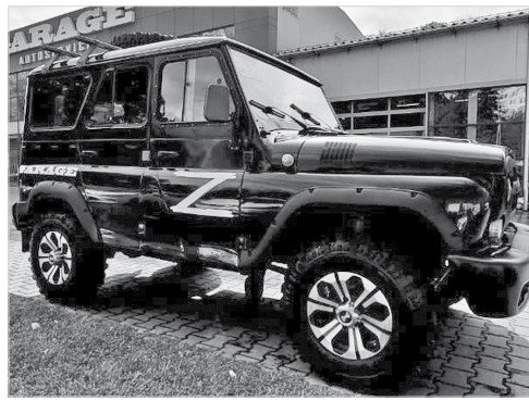
Автомобиль повышенной проходимости в момент приобретения и на фронте под Авдеевкой