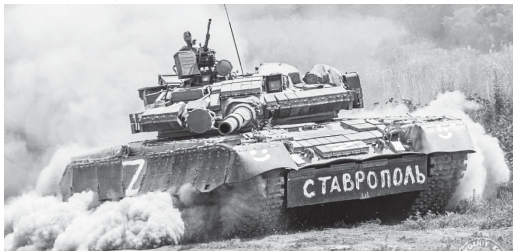
За Родину, за Ставрополь!