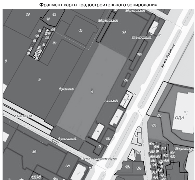
Фрагмент карты градостроительного зонирования

Приложение к изменениям, которые вносятся в Правила землепользования и застройки муниципального образования города Ставрополя Ставропольского края, утвержденные постановлением администрации города Ставрополя от 15.10.2021 № 2342